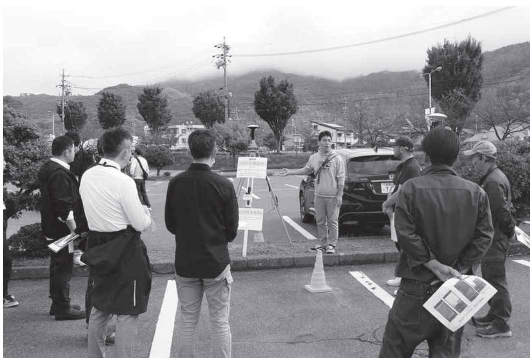
関東ブロック大会 in 長野